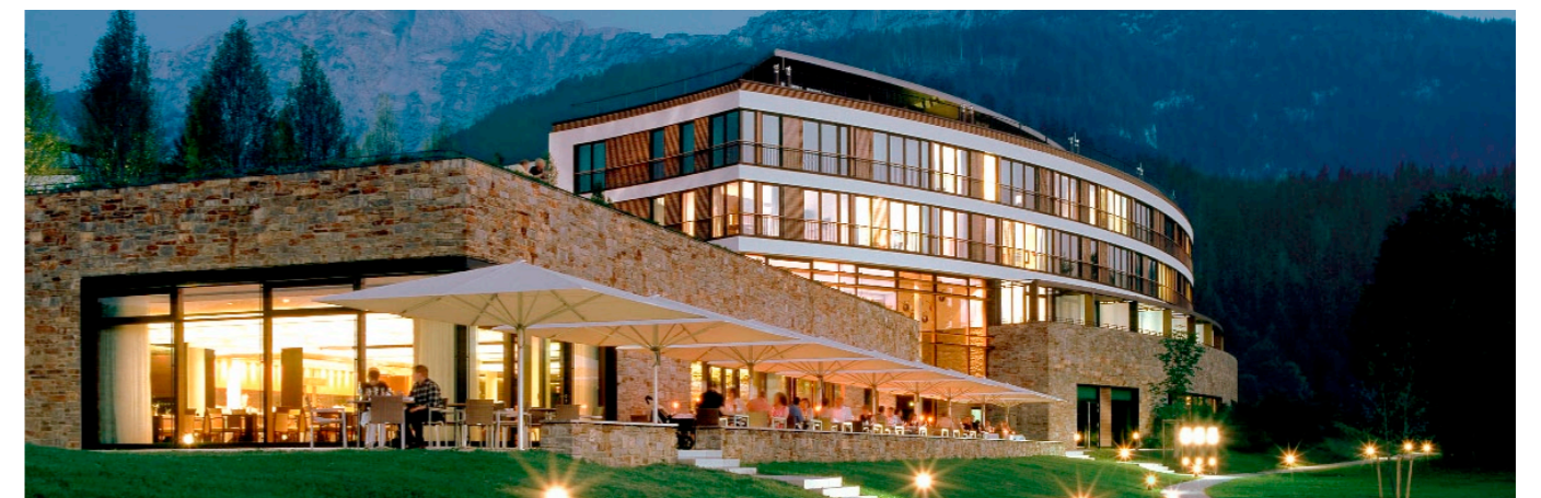
Ballsaal Von Vianen 1 & 2 Ballroom Von Vianen 1 & 2

* Tageslicht Natural daylight E = Erdgeschoss Ground floor Die Abmessungen sind ungefähre Angaben in Metern. Dimensions are approximate and in metres.