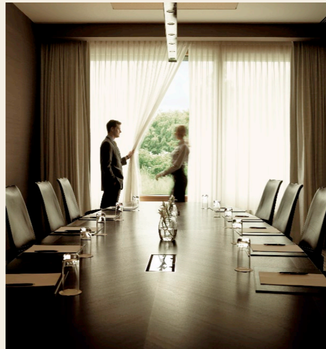
Foyer des Konferenzraums Von Vianen 1 & 2 foyer conference rooms Vianen 1 & 2

Event-Team: InterContinental Berchtesgaden Resort Tel.: +49 (0)8652 97 55 - 52 47 · Fax: +49 (0)8652 97 55 - 52 45 andreas.zybell@ihg.com · www.berchtesgaden.intercontinental.com